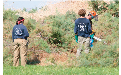
Student Conservation Association interns remove salt cedar by hand from fields and ditches on Cibola National Wildlife Refuge, AZ

Hechos sobresalientes de los Asociados Cada año, el Servicio trabaja con un grupo cada vez mayor de aliados. Los voluntarios de socios de hace mucho tiempo como la Asociación Estudiantil para la Conservación, la Fundación Nacional de Educación Ambiental y Take Pride in America dan muchas horas de apoyo a nuestros proyectos. En el año fiscal 2008, se establecieron asociaciones con el Laboratorio de Ornitología de Cornell, la Sociedad Americana de Excursionismo y la Administración Oceánica y Atmosférica Nacional.