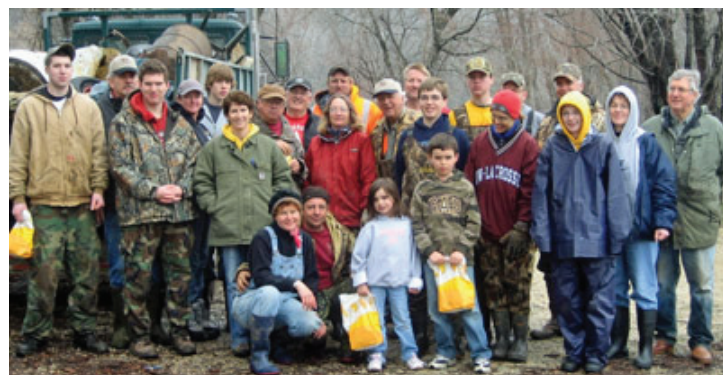
Amigos de Pool 9 y voluntarios se reúnen para la limpieza de un río en el extremo superior de Pool 9 del Refugio Nacional de Vida Silvestre y Pesca la parte superior del Río Mississippi, Iowa y Wisconsin

Amigos son vitales para las actividades del Servicio. Éstos aliados importantes abogan por su estación satélite suministrando información a la comunidad local y a los funcionarios electos, fomentando la participación de la comunidad en los programas y desarrollando apoyo de larga duración. Recaudan fondos y ofrecen personal voluntario para el trabajo de conservación que de otro modo podría quedarse sin hacer. Ayudan con programas de educación y eventos especiales. Amigos son un vínculo esencial a la comunidad para promover el manejo de la tierra. Dan su tiempo, habilidades y recursos para la conservación de vida silvestre.