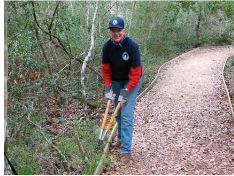
Un voluntario en el Refugio Nacional de Vida Silvestre de Aransas, TX, recorta la vegetación a lo largo de un sendero.

de águila, concursos de arte para jóvenes, grupos escolares, el campeonato de pesca para jóvenes, corte de césped, agricultura, mantenimiento de senderos, sondeos y giras. El evento más grande de voluntarios del refugio es el Festival Anual de Observación de Aves y de Herencia. Este año, un evento nuevo se sumó al festival-tiro al plato para jóvenes. Los voluntarios también ayudaron con los censos biológicos, incluyendo la continua expansión del monitoreo de golondrinas marinas y chorlitejos patinegros.