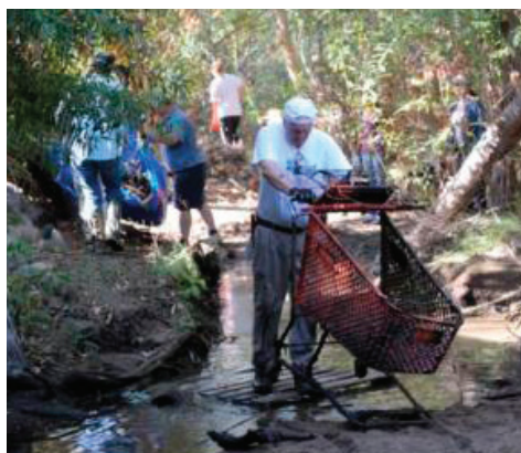
Voluntarios del Refugio Nacional de Vida Silvestre de Laguna Atascosa, TX, eliminan la basura del río Sweetwater en el Día Nacional de Tierras Públicas

El Refugio Nacional de Vida Silvestre del Lago Caddo, TX, trabajó con el Distrito de Navegación de Cypress Valley en una subvención de reto de