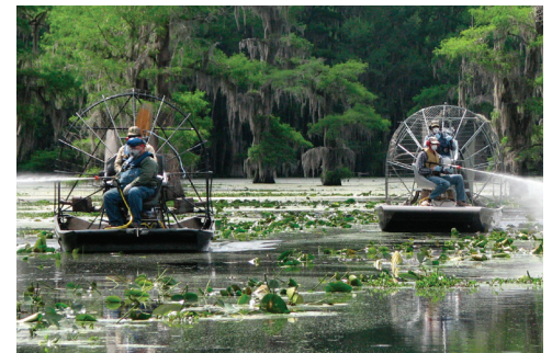
Equipos de rociado en la lucha contra salvinia en el lago Caddo.

Después de aprender acerca de áreas de juego no estructuradas para niños que visitan lugares naturales en la Conferencia de Amigos del 2008, los Amigos del Refugio Nacional de Vida Silvestre de la Bahía de Humboldt, CA , decidieron ofrecer juegos no estructurados en su propio refugio. Un sub-comité de Amigos se reunió con el