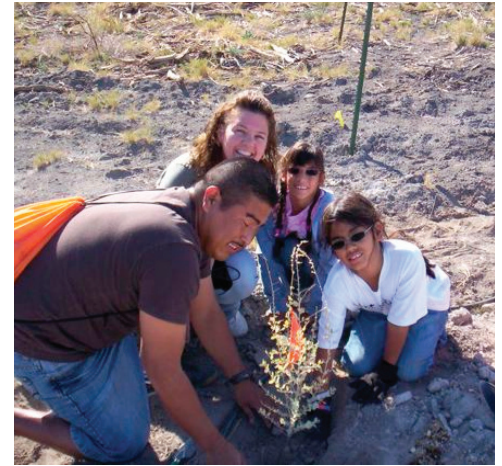
Un estudiante de la Escuela Primaria Tobler y su familia siembran vegetación nativa en el Refugio Nacional de Vida Silvestre de Ash Meadows, NV

cóndor de California. Ellos ayudaron al coordinador del cóndor de California crear una actualización mensual de la población la cual se distribuye a través del programa de recuperación y se utiliza en materiales de alcance.