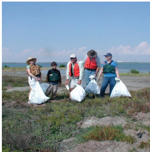
Voluntarios para Oficina Satélite de Servicios Ecológicos de Corpus Christi eliminan escombros de una isla de anidación de aves acuáticas coloniales de la parte superior de Laguna Madre, Corpus Christi, TX

pasaron medio día eliminando escombros de 45 islas de la parte superior de Laguna Madre. La oficina satélite se asoció con el Programa de Bahías y Estuarios del Sector Costero, el Departamento de Parques y Vida Silvestre de Texas, Audubon y Estudios Geológicos de los EE.UU. para proporcionar apoyo logístico para los esfuerzos de limpieza. Voluntarios vinieron de varias tropas de Niños Escuchas, una unidad ROTC, una iglesia y el público en general. Los desperdicios recolectados llenaron un camión de basura grande, provisto por el Departamento de Aguas Pluviales de la Ciudad de Corpus Christi.