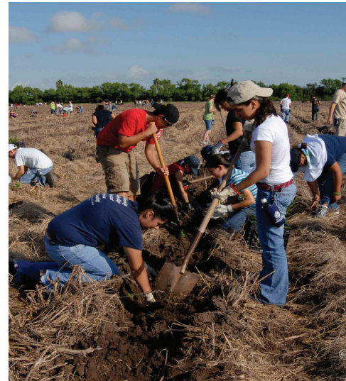
Cerca de 700 voluntarios plantaron árboles y arbustos durante la actividad anual Reforestación de Río, que tomo lugar en el Refugio Nacional de Vida Silvestre del Valle Inferior del Río Grande, TX

verificaba las rutas de sondeo de aves de cría en el noroeste de Chihuahua, México y recolectó sistemas de información geográficos y datos del hábitat. El voluntario también comenzó un análisis en un sistema de río no estudiado, proporcionando nuevos datos sobre la distribución de las aves. Biólogos de The Nature Conservancy en México ayudaron con el proyecto. Cerca de 700 voluntarios ayudaron con Reforestación de Río, un evento de medio día en el Refugio Nacional de Vida Silvestre del Valle Inferior del Río Grande, TX. Plantaron más de 11,000 árboles y arbustos nativos en 15 acres. Voluntarios